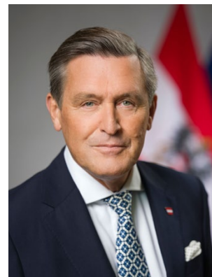
Bundesminister KommR Peter Hanke

Bundesminister für Innovation, Mobilität und Infrastruktur