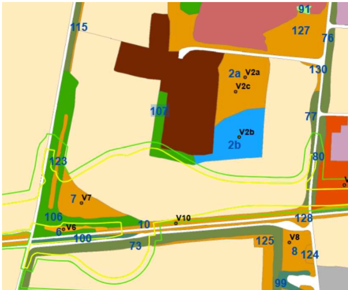
Abbildung 2: Ist-Zustand Biotope EP 2014 (Quelle: Einlage Einlage 1: Umweltbericht - Forstrechtliches Einreichoperat, September 2025)

Eine Aktualisierung der Erhebungen im Jahr 2022 ergab, dass der Anteil an Offenflächen durch die zunehmende Gehölzsukzession zurückgegangen ist, die grundsätzliche Bedeutung als Tierlebensraum aber gleichgeblieben ist.